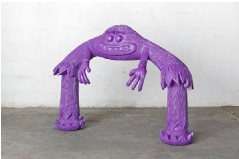
Cameron Platter Purpl Monster, 2015 Sculpture 120 x 150 x 50 cm Galerie Ernst

Cependant, cet engouement récent, qu'il soit celui du marché, des institutions ou du grand public, révèle un certain retard du regard sur la création africaine contemporaine dans l'Hexagone : « Que sait-on vraiment de l'art de ce continent et de son histoire dont les représentants des périodes modernes et contemporaines ont été très peu montrés ? (...) il nous a semblé pertinent de livrer quelques éclairages et des pistes de réflexion permettant d'ouvrir d'autres perspectives sur la création artistique actuelle de ce continent. »